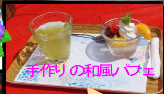
手作りの和風パフェ

今年の和菓子の日には、手作りの和風パフェ!「和菓子を食べ、これからもずっと元気で過ごせますように」と健康祈願をされていました!また、色とりどりの紫陽花を觀賞され、「こんな色の紫陽花は見たことないな〜」「やっぱりこの時期は紫陽花に限るね〜」と喜んでおられました!もちろん、和風パフェも「爽やかに美味しい!」と召し上がっていただきました。