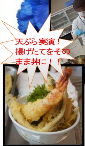
天ぷら実演! 揚げたてをそのまま丼に!!

今年の父の日の主役は7名の男性入居者様で、職員手作りのブルーのカーネーションをプレゼントしました。カーネーションを片手に、ニコリと微笑んでくれました。天丼には、大きな穴子と海老かドーン!と盛り付けられ「美味しいなー」と喜びの声を聞くことができました!