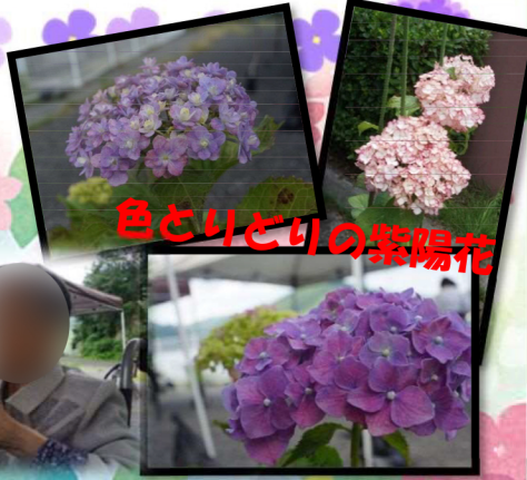
色とりどりの紫陽花

今年の和菓子の日には、手作りの和風パフェ!「和菓子を食べ、これからもずっと元気で過ごせますように」と健康祈願をされていました!また、色とりどりの紫陽花を觀賞され、「こんな色の紫陽花は見たことないな〜」「やっぱりこの時期は紫陽花に限るね〜」と喜んでおられました!もちろん、和風パフェも「爽やかに美味しい!」と召し上がっていただきました。